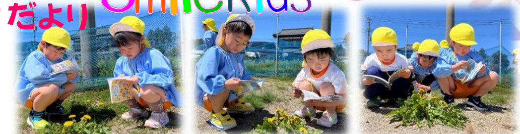
このお花の名前は～???